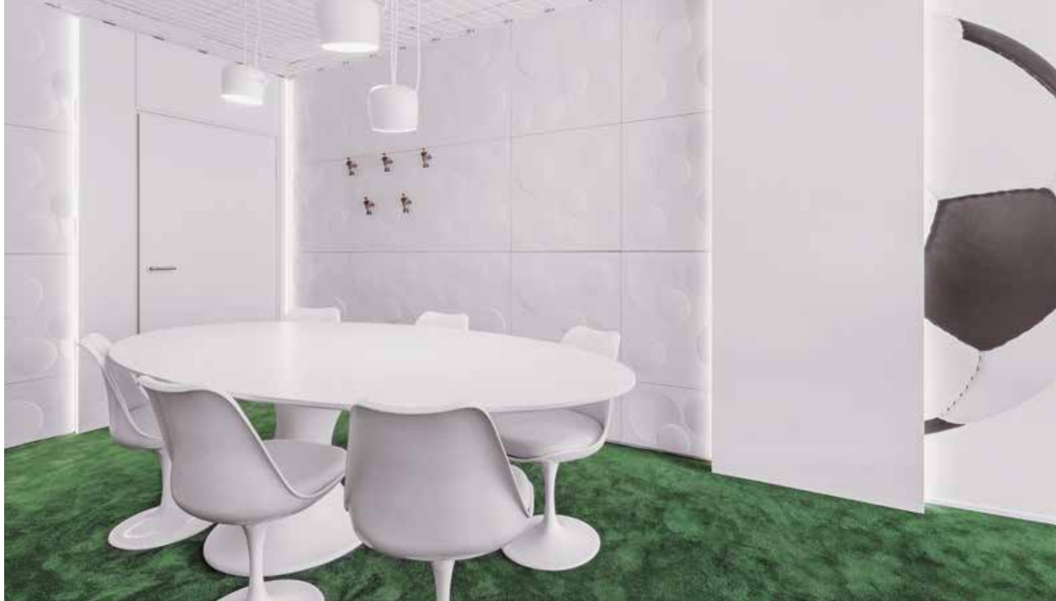
Tagungsstätte und Fantreff: Die Firmenloge vereint Arbeit und Vergnügen.