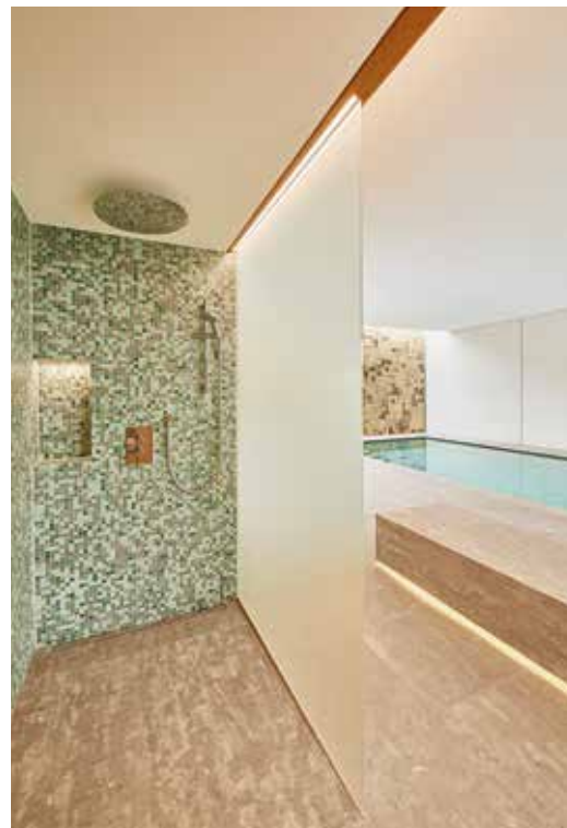
Blick von der Dusche in die Schwimmhalle

Tagsüber wird das Wandbild indirekt durch ein Oberlicht in Szene gesetzt. Am Abend wird die Fläche mit Kunstlicht beleuchtet, was der goldenen Fläche noch