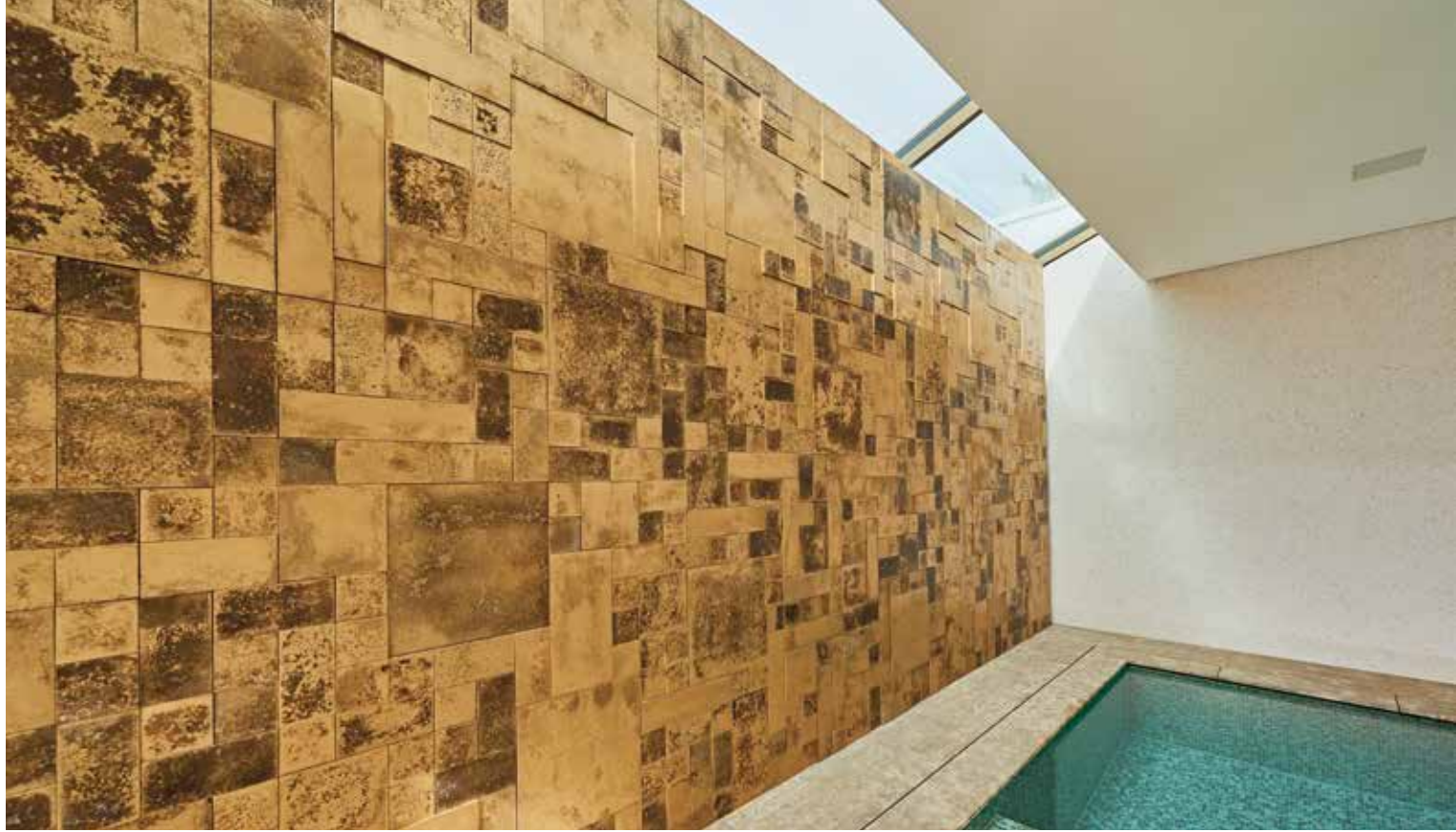
Am Tag wird die Wand durch das natürliche Tageslicht in Szene gesetzt